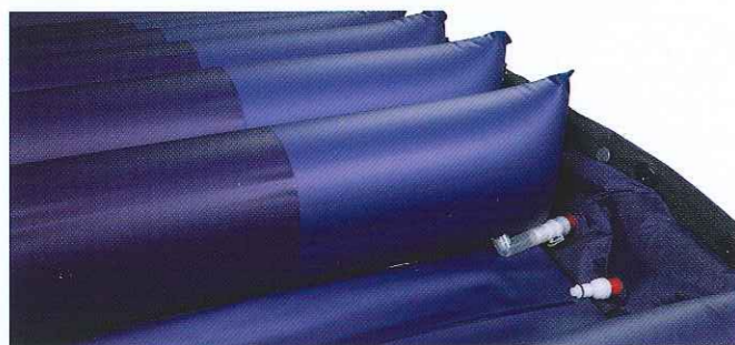
Connettori con valvola di non ritorno per lo scarico totale di ogni singola cella.

Supportate da una base in schiuma poliuretanicata di 5 cm, 20 celle attive, in puro poliuretano 100% ad elevatissima elasticità, si adattano e si conformano perfettamente alla morfologia del paziente. Sono indipendenti, tra loro intercomunicanti e tutte singolarmente escludibili per consentire di personalizzare la superficie del materasso ad ogni specifica esigenza posturale.